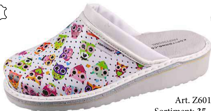
Art. Z601 60 Sortiment: 35 - 43