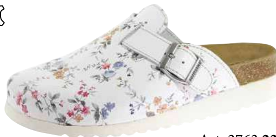
Art. 2763 23