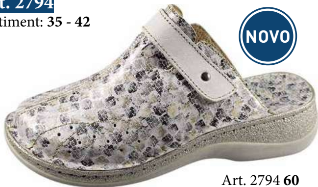
Art. 2794 60