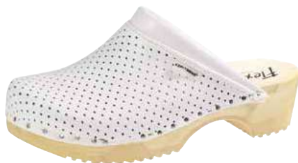
Art. 2202 00 Sortiment: 35 - 47