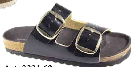
Art. 3221 62