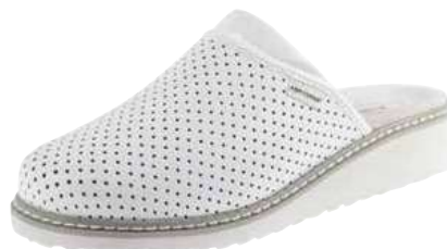
Art. Z608 00