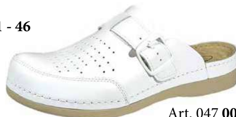
Art. 047 00