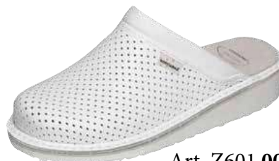
Art. Z601 00 Sortiment: 35 - 48