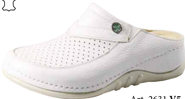
Art. 2631 V5