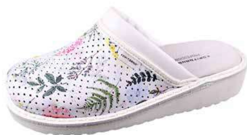
Art. Z601 41 Sortiment: 35 - 43