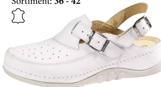
Art. 1140 V5