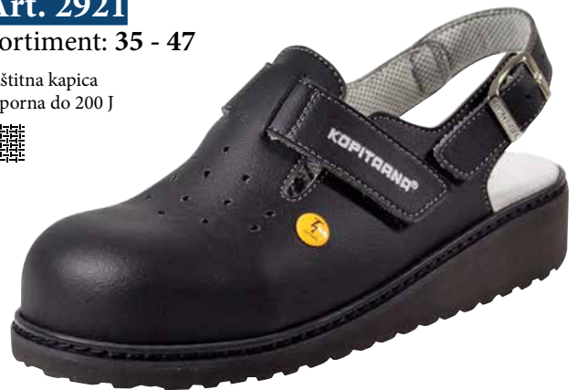
Art. 2921 17