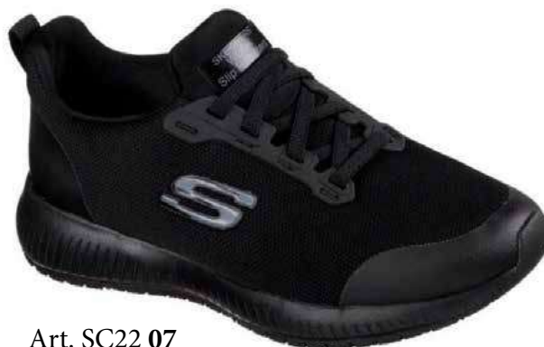
Art. SC22 07