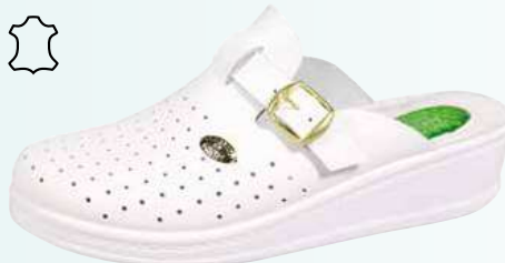
Art. 041 00