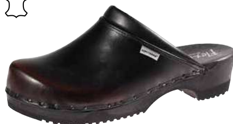
Art. 2201 79