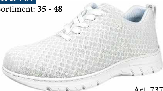
Art. 737 00