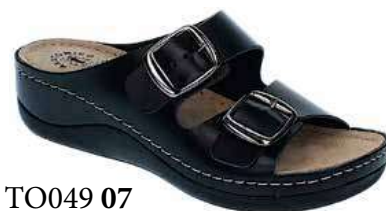
Art. TO049 07