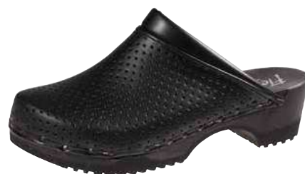
Art. 2202 07 Sortiment: 35 - 47