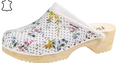
Art. 2202 23 Sortiment: 36 - 42