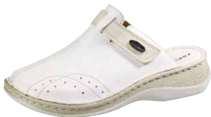
Art. 2794 09