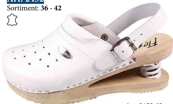
Art. 2452 60