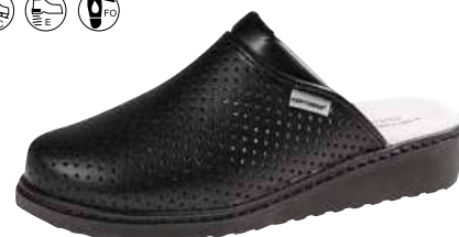
Art. Z608 07