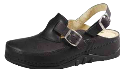
Art. 1140 VA