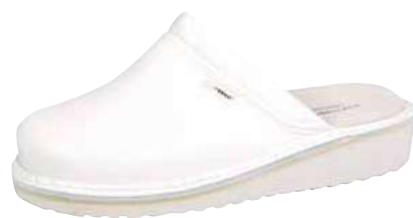
Art. 2896 00