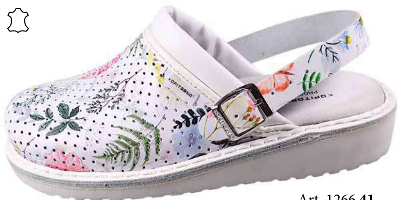
Art. 1266 41