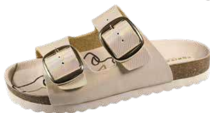
Art. 3221 64