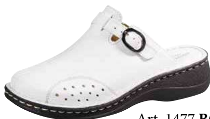
Art. 1477 BG