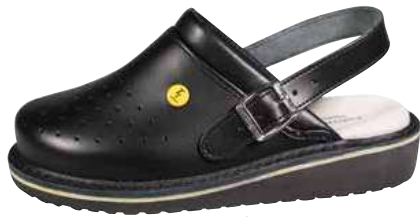
Art. 2795 07