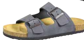
Art. 3101 14 Sortiment: 39-50