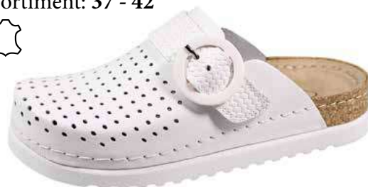
Art. TO051 00