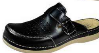
Art. 047 07