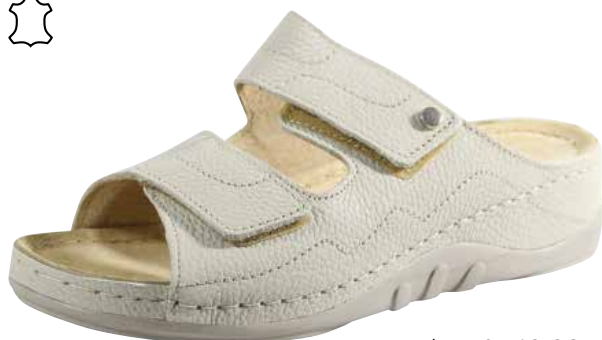
Art. 2748 09