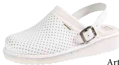
Art. 1266 00