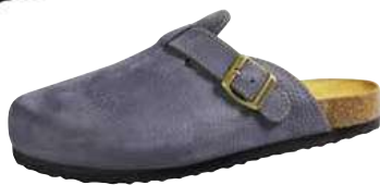
Art. 1828 12 Sortiment: 38 - 47