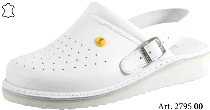
Art. 2795 00