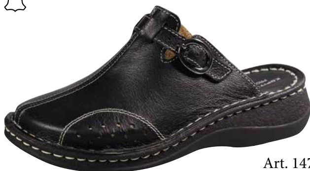
Art. 1477 BF