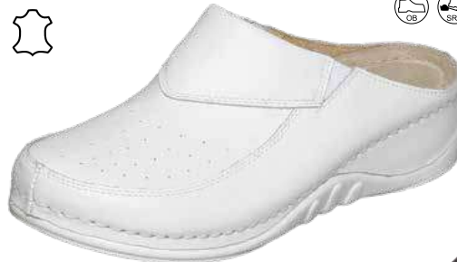
Art. N734 V5