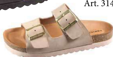
Art. 3144 60