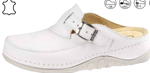
Art. 1141 V5