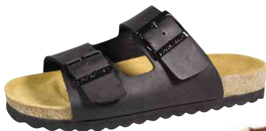
Art. 3144 12