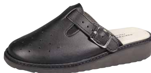
Art. 3079 17