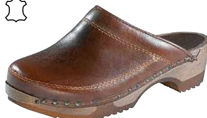
Art. 2111 RI