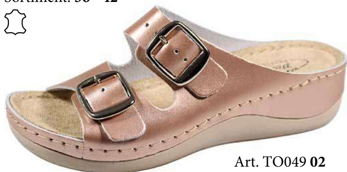
Art. TO049 02