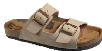
Art. 3101 61 Sortiment: 39-47