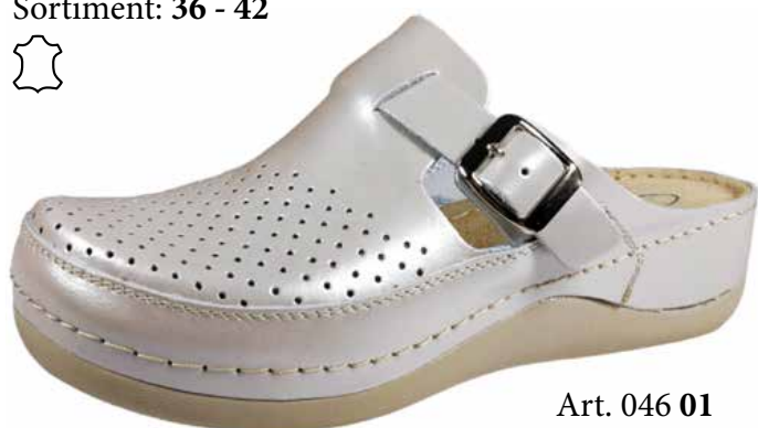
Art. 046 01