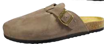
Art. 1828 06 Sortiment: 40 - 47