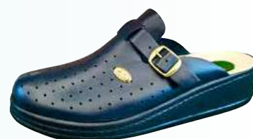
Art. 041 01