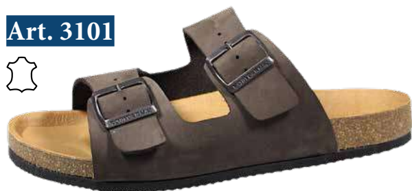
Art. 3101 13 Sortiment: 39-50