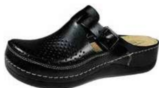
Art. 046 07