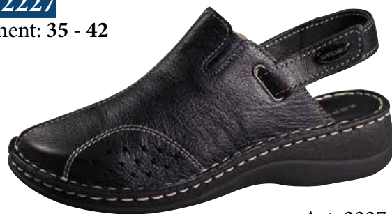
Art. 2227 07