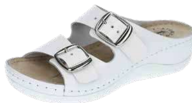
Art. TO049 00