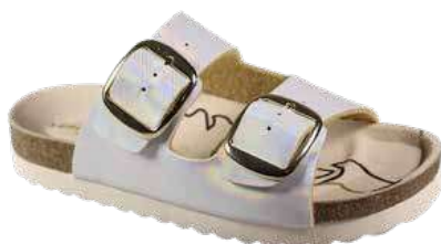
Art. 3221 63