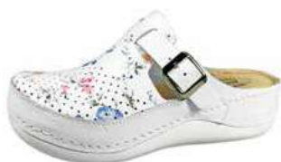
Art. 046 23