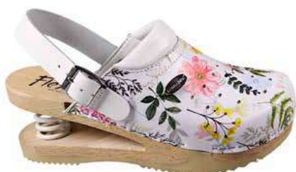
Art. 2452 41