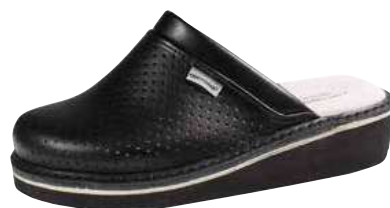
Art. 601 07