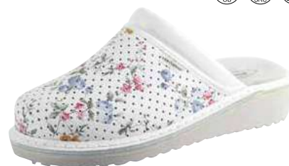
Art. Z601 23 Sortiment: 35 - 43