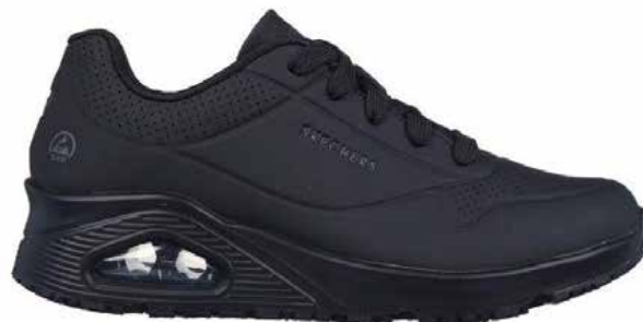
Art. SC21 07