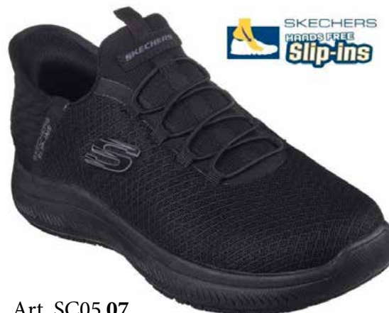
Art. SC05 07