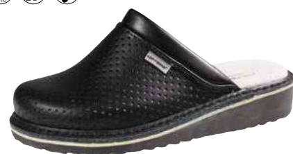
Art. Z601 07 Sortiment: 35 - 48