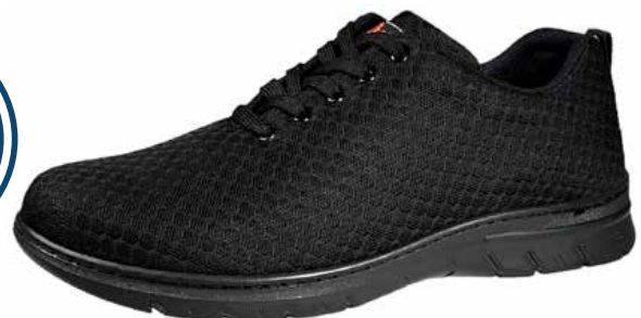
Art. 737 07