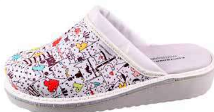
Art. Z601 42 Sortiment: 35 - 43