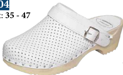
Art. 2204 00