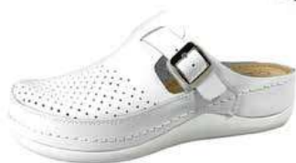
Art. 046 00