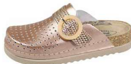
Art. TO051 02