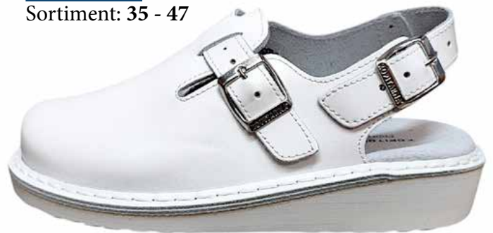
Art. A602 00