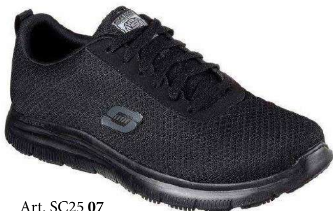
Art. SC25 07