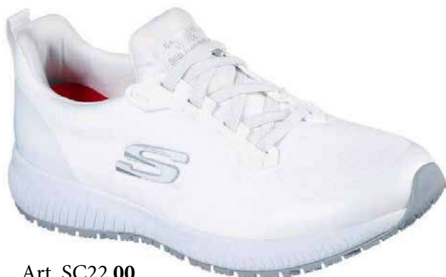
Art. SC22 00