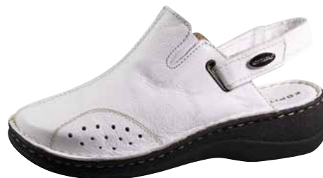
Art. 2227 00