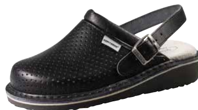
Art. 1266 07