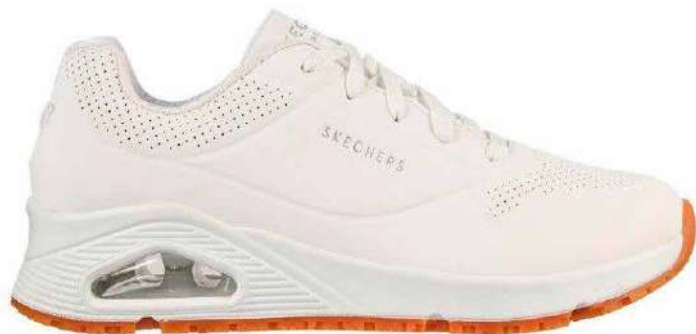
Art. SC21 00