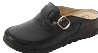
Art. 1141 VA