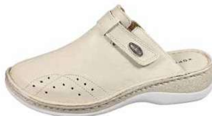
Art. 2794 40