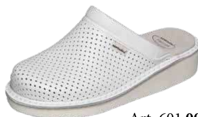
Art. 601 00