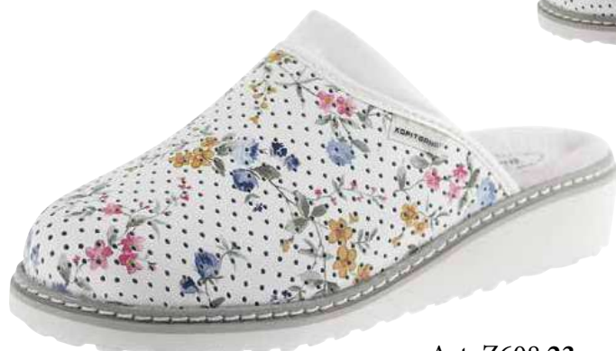
Art. Z608 23