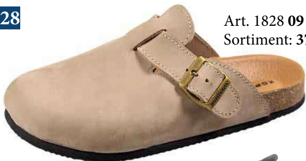
Art. 1828 09 Sortiment: 37 - 43