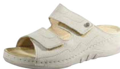
Art. 2748 09