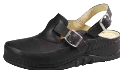
Art. 1140 VA