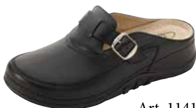
Art. 1141 VA