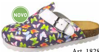
Art. 1828 40 Sortiment: 36 - 43