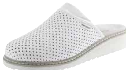
Art. Z608 00