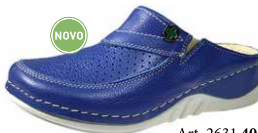
Art. 2631 40