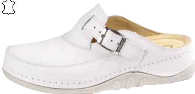
Art. 1141 V5