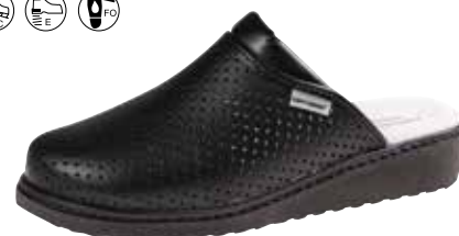
Art. Z608 07