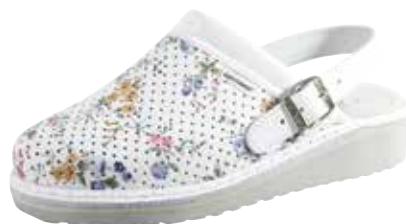
Art. 1266 23 Sortiment: 35 - 43