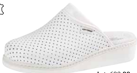
Art. 608 00