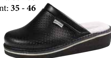
Art. 601 07 Sortiment: 35 - 46