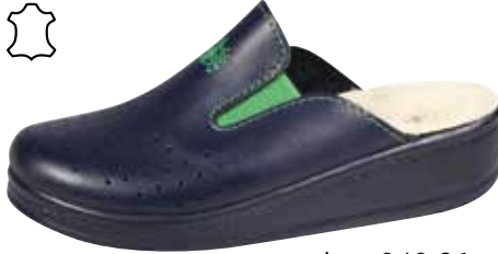
Art. 040 01