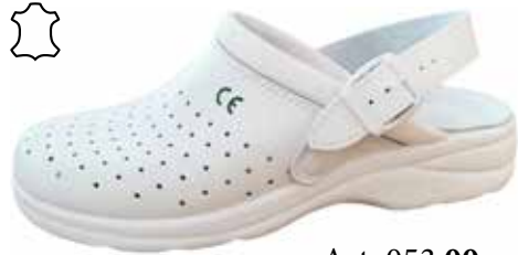
Art. 053 00