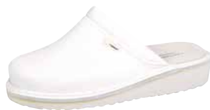
Art. 2896 00