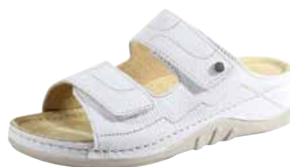
Art. 2748 V5