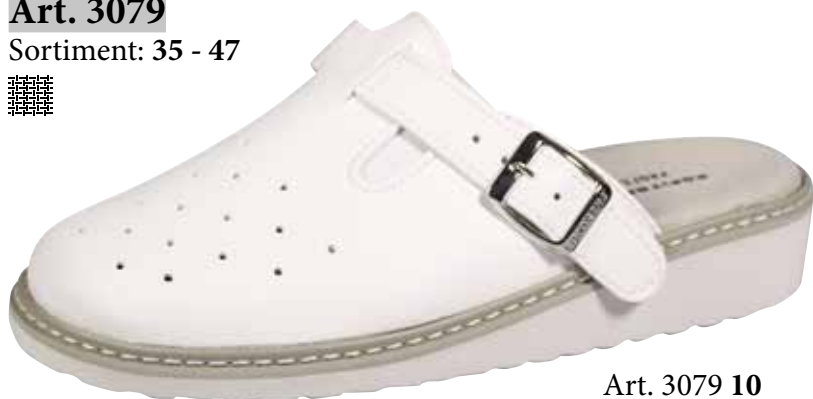
Art. 3079 10