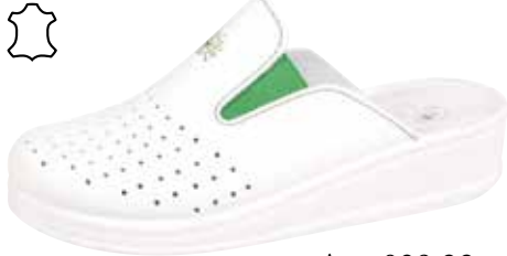
Art. 039 00