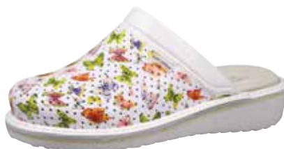
Art. Z601 32 Sortiment: 35 - 43