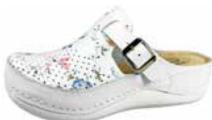
Art. 046 23