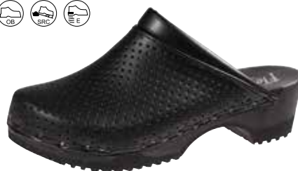
Art. 2202 07 Sortiment: 35 - 47