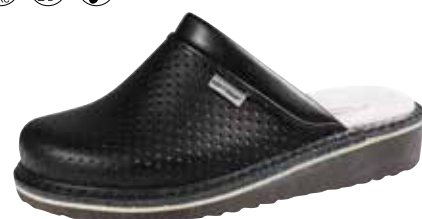
Art. Z601 07 Sortiment: 35 - 48