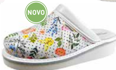
Art. 601 41 Sortiment: 35 - 42