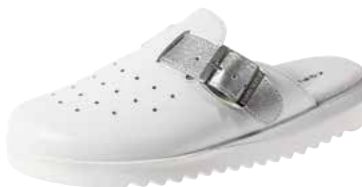
Art. 2926 94