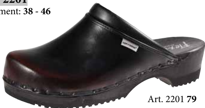
Art. 2201 79