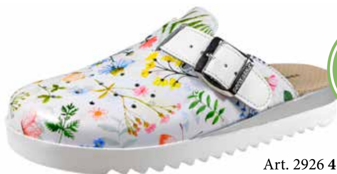
Art. 2926 41