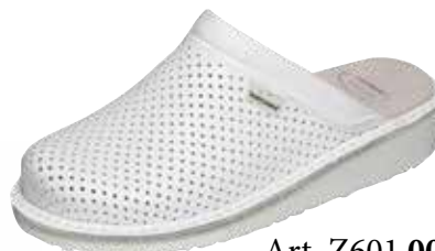
Art. Z601 00 Sortiment: 35 - 48