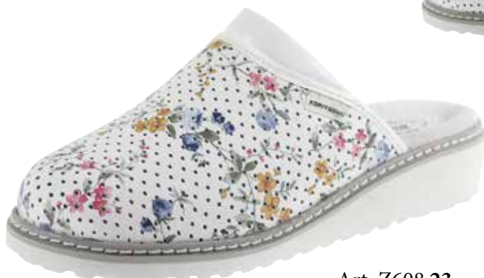
Art. Z608 23