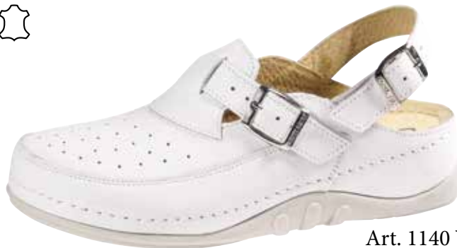
Art. 1140 V5