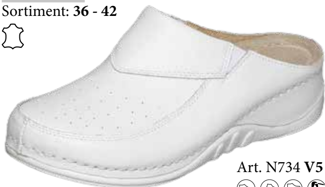
Art. N734 V5