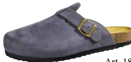
Art. 1828 12 Sortiment: 38 - 50