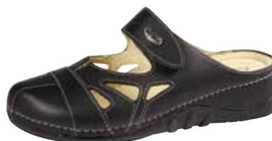
Art. 1975 07