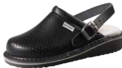
Art. 1266 07 Sortiment: 35 - 48