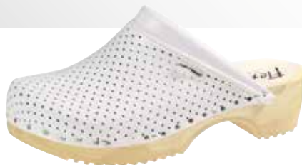
Art. 2202 00 Sortiment: 35 - 47