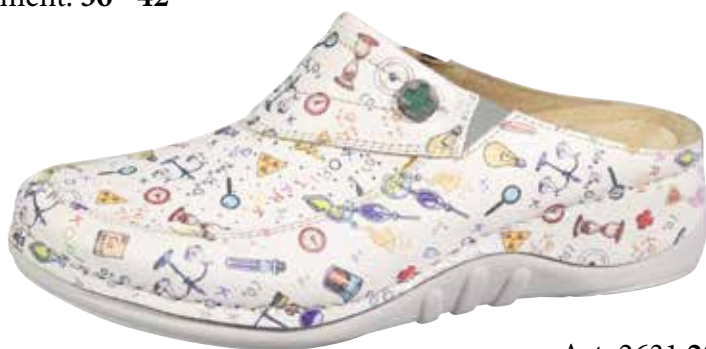
Art. 2631 20