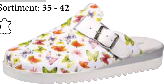
Art. 2926 32