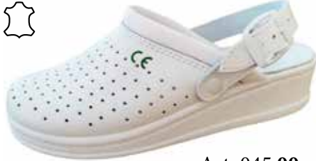
Art. 045 00