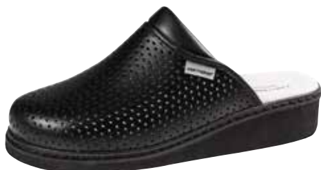
Art. 608 07