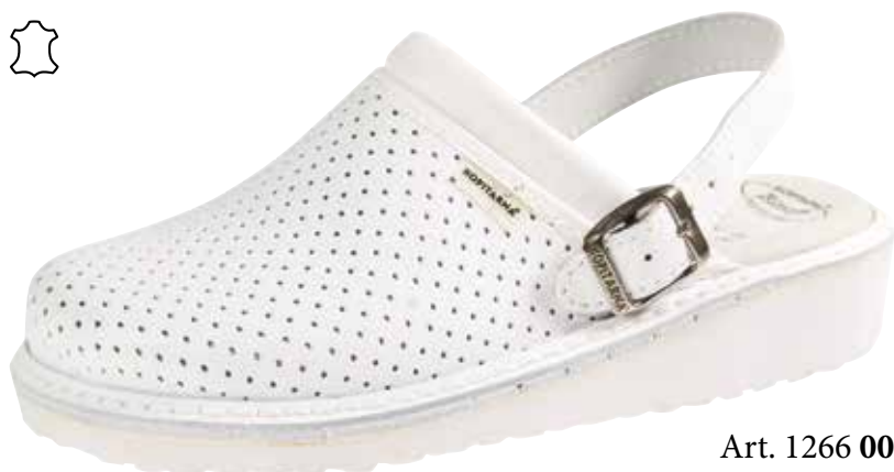
Art. 1266 00 Sortiment: 35 - 48