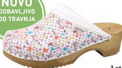
Art. 2202 43 Sortiment: 36 - 42