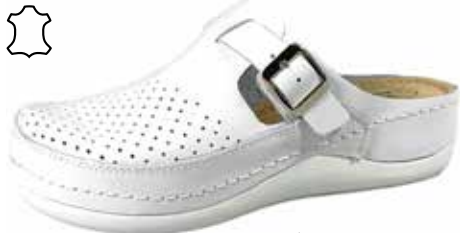
Art. 046 00