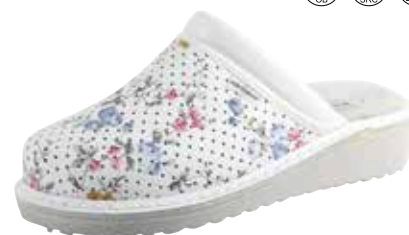
Art. Z601 23 Sortiment: 35 - 43