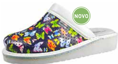
Art. Z601 40 Sortiment: 35 - 43