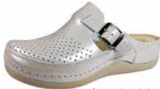
Art. 046 01