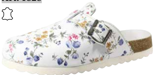
Art. 1828 23 Sortiment: 36 - 43