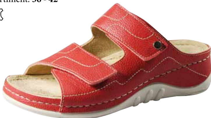
Art. 2748 08