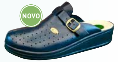
Art. 041 01