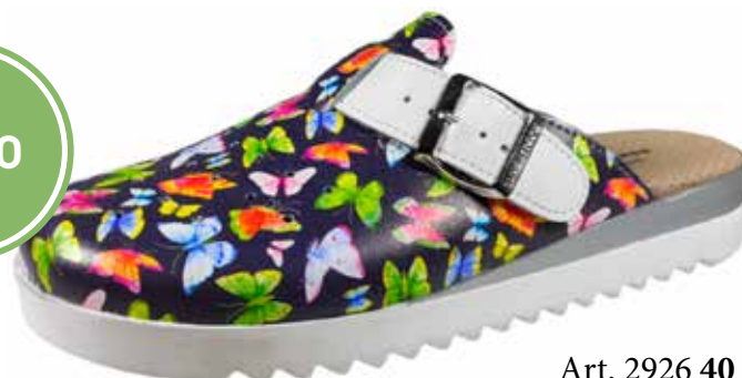
Art. 2926 40