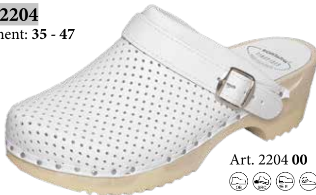
Art. 2204 00