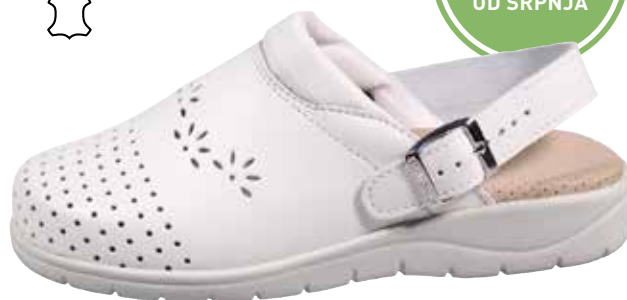
Art. 3213 00