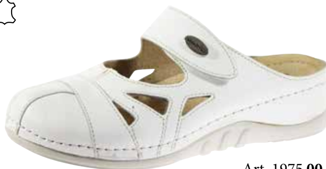
Art. 1975 00