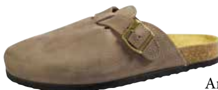
Art. 1828 06 Sortiment: 40 - 50