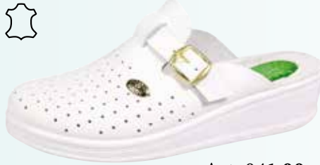
Art. 041 00