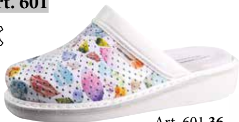
Art. 601 36 Sortiment: 35 - 43