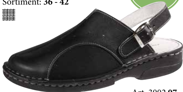
Art. 3002 07