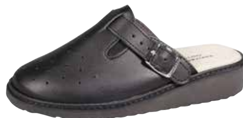
Art. 3079 17