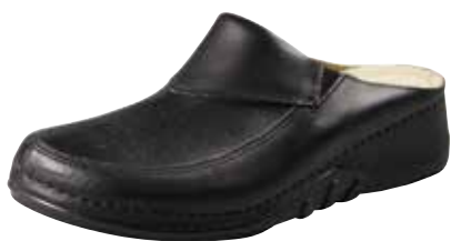
Art. N734 VA