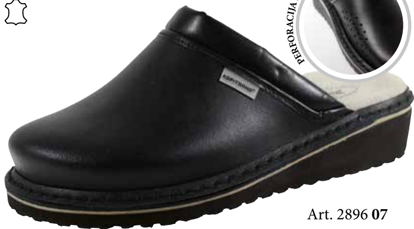
Art. 2896 07