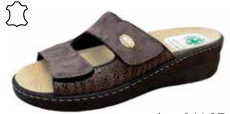
Art. 044 07