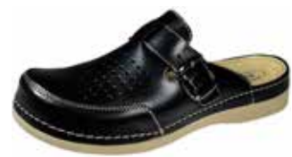
Art. 047 07