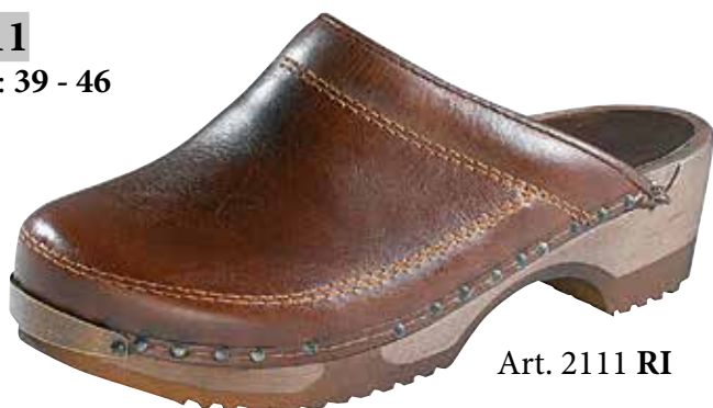
Art. 2111 RI