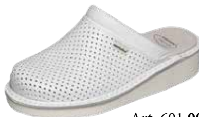
Art. 601 00 Sortiment: 35 - 46