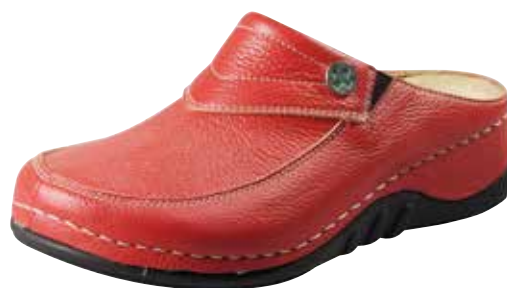
Art. 2631 08