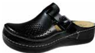
Art. 046 07