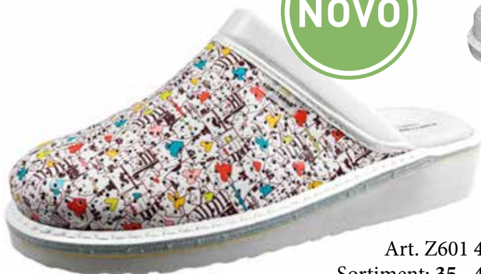
Art. Z601 42 Sortiment: 35 - 43