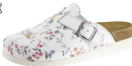
Art. 2763 23