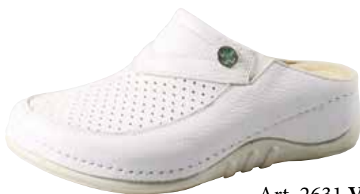
Art. 2631 V5