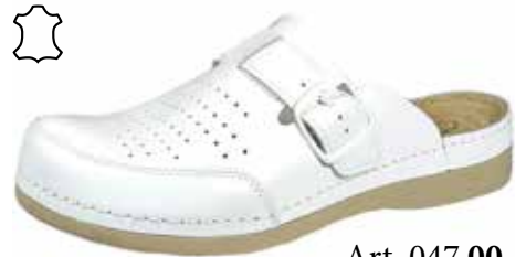
Art. 047 00