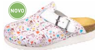
Art. 2763 43